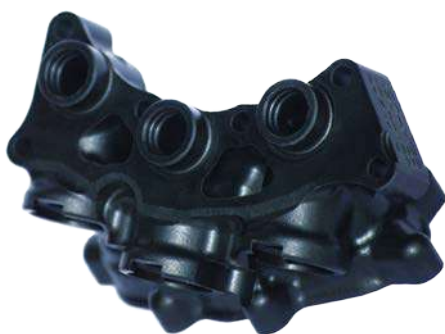
settore Automotive materiale PA66GF30