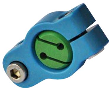
settore Industria Medicale materiale PEEK