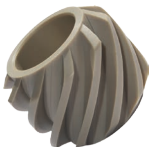
settore Packaging materiale PEEK