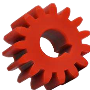
settore Packaging materiale PA6C