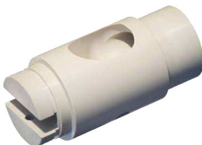
settore Alimentare materiale PEEK