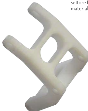
settore Packaging materiale POM