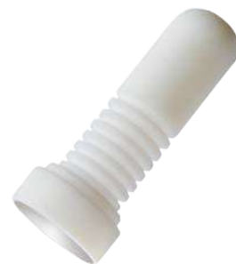
settore Packaging materiale PTFE