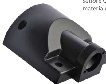
settore Alimentare materiale POM