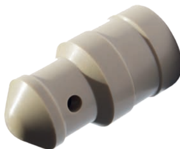
settore Alimentare materiale PEEK