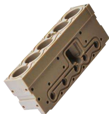
settore Chimico/Farmaceutico materiale PEEK