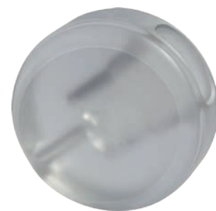
settore Farmaceutico materiale PC