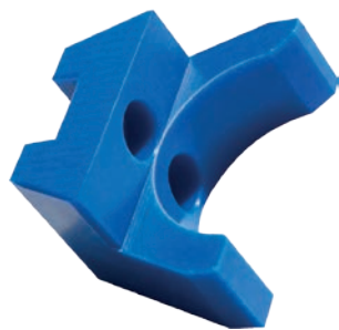
settore Packaging materiale PE